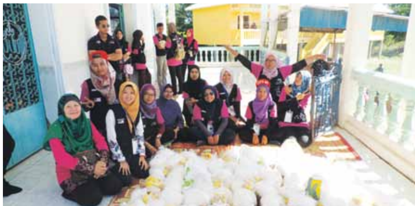
Sukarelawan Kelab Penyayang UMT.

kampung yang memerlukan turut diadakan. Barangan ini adalah hasil sumbangan syarikat korporat, peniaga dan orang perseorangan di Malaysia.