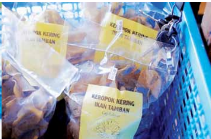
Antara produk yang dihasilkan oleh kilang keropoknya.