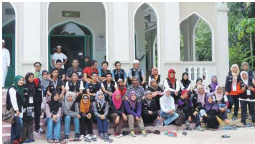
Sukarelawan Kelab Penyayang UMT di hadapan Masjid di Kemboja.

Pelbagai aktiviti dilaksanakan sepanjang program ini iaitu korban, berkhatan, sukaneka, pemeriksaan kesihatan, pertandingan mewarna, perlawanan bolasepak dan pertunjukan wayang pacak turut diadakan. Di samping itu pemberian bantuan berupa makanan, basikal, kipas, pam air dan generator kepada penduduk