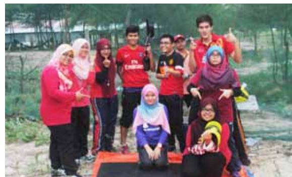
Barisan fasilitator ketika aktiviti bermain 'paintball'.

Program tersebut telah dijalankan pada 26 hingga 28 September 2013 di Nur Merang Inn Resort, Setiu. Program yang lebih bersifat santai itu turut dimuatkan dengan beberapa slot ilmiah yang memberi pendedahan kepada barisan kepimpinan HISAAC mengenai ilmu menjadi seorang pemimpin dan insan yang berjaya di