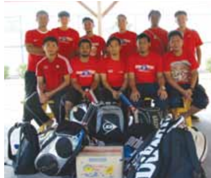
Sebahagian atlet tenis UMT pada hari kejohanan.

Oleh itu, diharapkan pasukan tenis UMT terus gemilang dan mencapai lebih banyak kejayaan di masa akan datang di samping dapat mengharumkan nama Universiti Malaysia Terengganu.