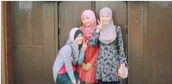
Bersama rakan 'study group'.