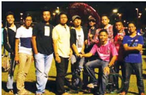
Pelajar Diploma Perikanan terhibur pada malam santai.