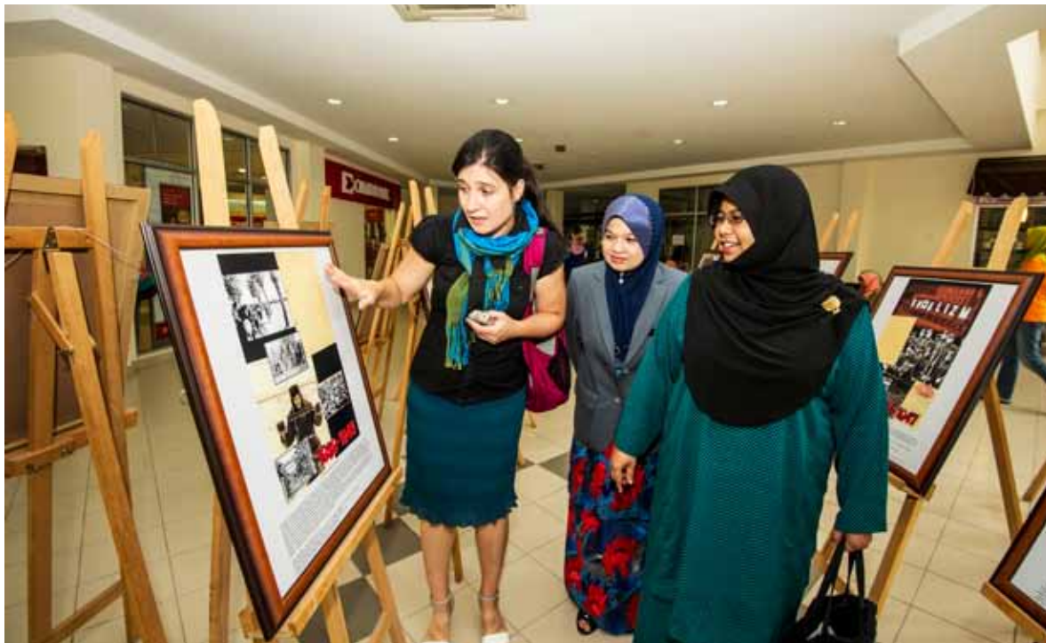
oleh : Fadzilah Ambak Jaringan Antarabangsa