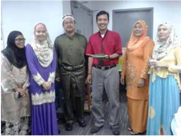
Bersama CEO dan Ketua Jabatan Kewangan PETRONAS Chemicals Derivatives Sdn. Bhd.