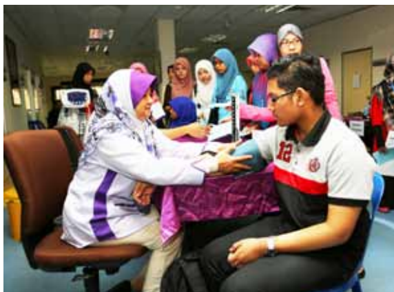
Pelajar menjalani pemeriksaan tekanan darah.

Pemeriksaan dan Konsultasi yang menyeluruh oleh Pegawai Perubatan dan Pegawai Pergigian telah diberikan kepada setiap pelajar. Pelaporan keseluruhan akan diberikan kepada pihak universiti. Penulisan semi jurnal dan