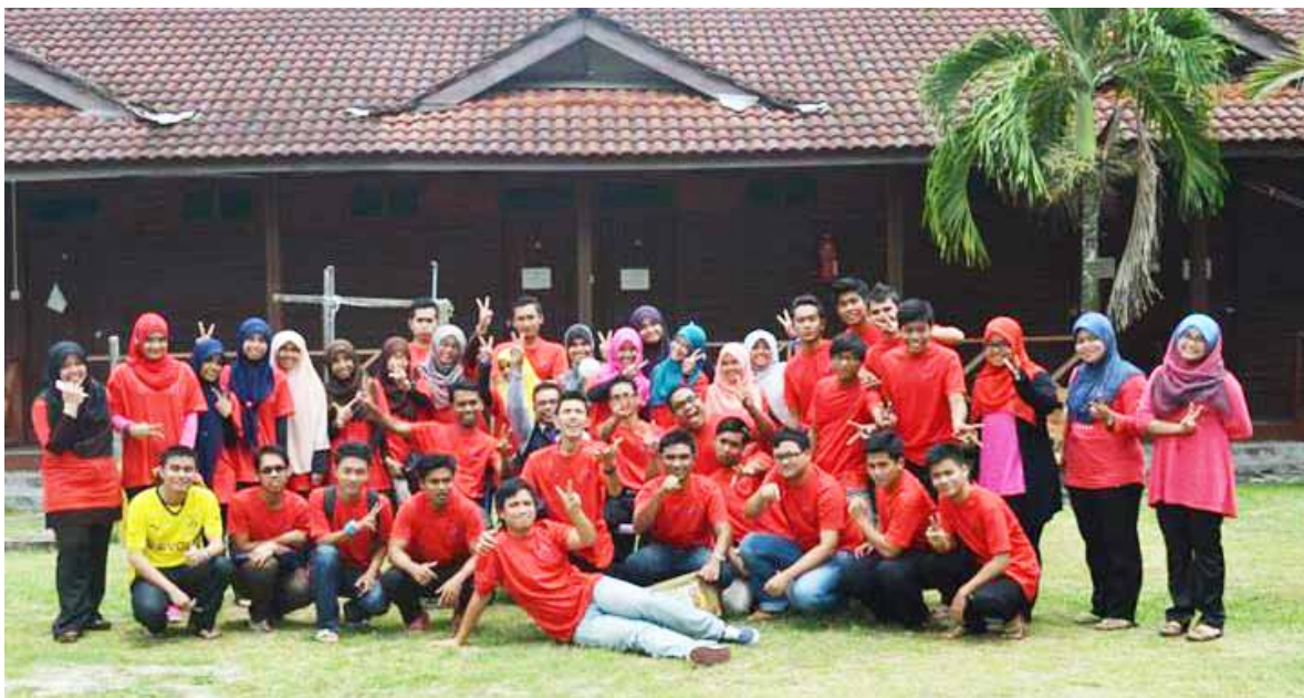
Peserta Kem Kepimpinan HISAAC.

K elab Himpunan Siswa Siswi Perakaunan Universiti Malaysia Terengganu atau lebih dikenali sebagai HISAAC UMT telah menyediakan pelbagai program yang melibatkan sebilangan besar mahasiswa Sarjana Muda Perakaunan sepanjang tahun 2013. Kelab yang berada di bawah Fakulti Pengurusan dan Ekonomi ini dalam usaha untuk menaikkan nama HISAAC dan menjadikan antara kelab yang teraktif di UMT.