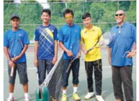
Bergambar kenangan sebelum perlawanan.