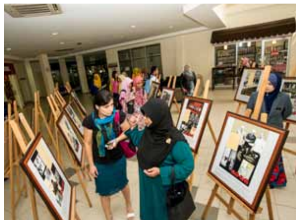
Para pelajar juga berkesempatan melawat ruang pameran.

pelajar, malah ia juga dapat meluaskan jaringan antarabangsa serta menyokong visi UMT sebagai sebuah universiti berfokus marin terunggul dalam negara dan disegani di peringkat global.