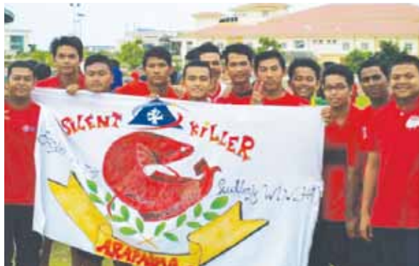
Semangat rumah Arapaima dengan bendera ciptaan mereka.

Seusai ucapan pengarah program, pertandingan persembahan daripada setiap wakil rumah yang dimulai dengan rumah Arowana, rumah Arapaima, rumah Toman dan diakhiri dengan rumah Todak. Setelah selesai sesi persembahan, ucapan daripada mantan Presiden REVOF iaitu saudara Mohd Fazirullah bin Abdul Majid lantas merasmikan majlis penutupan Program Hari Olahraga dan Malam Santai (HOMS). Selepas itu, sesi penyampaian hadiah diberikan kepada para pemenang yang telah berjaya. Majlis telah berakhir pada jam 11.30 malam.