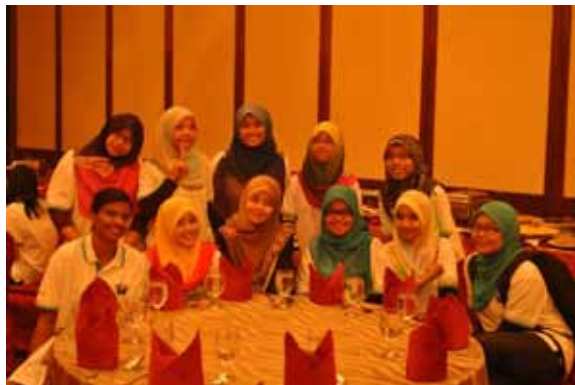
Bersama komuniti 'Accounting Student Conference.'