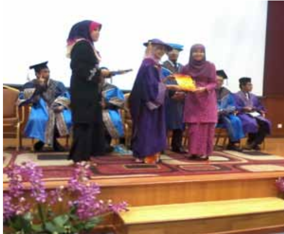
Menerima Anugerah Dekan.