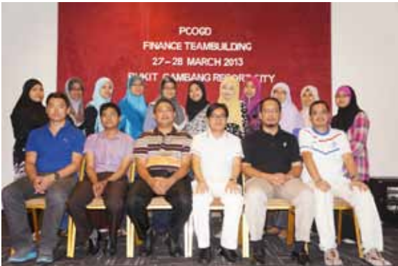
'Teambuilding' semasa latihan industri.

“... saya melibatkan diri dalam aktiviti Kelab Penyayang UMT dengan membuat kerja sukarela dan melawat sebuah FELDA di Terengganu selain mewakili UMT di dalam acara 4 x 400m di kejohanan MASUM.”