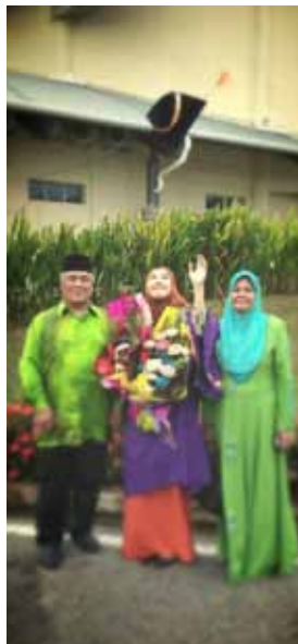
Bersama ibu bapa ketika Majlis Konvokesyen ke-11 UMT.

“... saya melibatkan diri dalam aktiviti Kelab Penyayang UMT dengan membuat kerja sukarela dan melawat sebuah FELDA di Terengganu selain mewakili UMT di dalam acara 4 x 400m di kejohanan MASUM.”