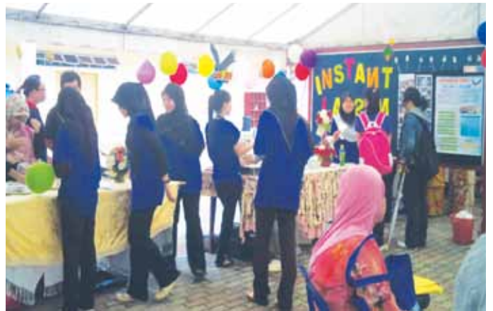
Pameran produk yang dijalankan oleh para peserta.