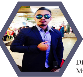
Disediakan oleh: Muhammad Ameerul Hafiz Bin Mohd Rosli