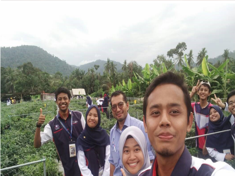
Lawatan ke sekitar kampung melihat keistimewaan kampung seperti ladang cili fertigasi bersama Ketua Kampung dan Penyelaras Kelab.