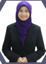
Disediakan oleh: Noor Adilatul Husna Binti Arfiec