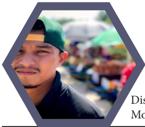
Disediakan oleh: Mohd Syafiq Aizat Bin Abdul Aziz