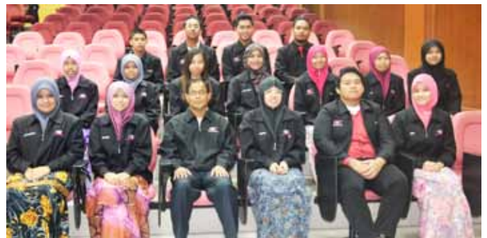
Tulang belakang kepada Program International Mathematics Convention 2013 (IMC'13).

Burumatik atau Buru Matematik pula ialah aktiviti luar seperti explorace yang melibatkan pelajar menyelesaikan beberapa bentuk soalan matematik untuk bergerak ke checkpoint yang lain. Secara ringkasnya, program ini berunsurkan para peserta yang dibahagikan kepada beberapa kumpulan. Kumpulan-kumpulan ini akan diberikan taklimat dan bermula di pusat penyaringan ( checkpoint ) yang ditetapkan. Setiap pusat penyaringan ( checkpoint ) akan diberikan tugas-tugas tertentu. Tugas-tugas ini menguji kepantasan dan ketangkasan minda bagi menyelesaikan masalah matematik dengan cepat serta menguji sejauh mana pembelajaran matematik yang telah dipelajari selama ini dapat diaplikasikan secara praktikal dan