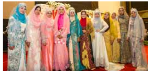
Barisan MPP dan Pengacara majlis kelihatan anggun bergaya dalam busana pengantin tajaan Butik Seri Cendana.