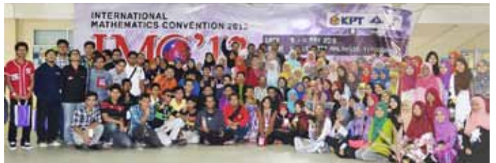
Sesi bergambar bersama peserta IMC'13

pada masa yang sama menguji ketahanan fizikal dan emosi para peserta. Pertandingan ini disertai oleh pelajar UMT, UM, USIM, UIAM dan UiTM Dungun. Pertandingan telah dimenangi oleh kumpulan Alpha yang diwakili oleh peserta dari UIAM yang telah mendapat tempat pertama. Tempat kedua telah dimenangi oleh peserta dari kumpulan Sigma dari UMT dan tempat ketiga juga dimenangi oleh peserta dari UMT iaitu dari kumpulan Delta.