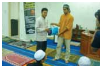
Perberian cenderamata kepada penceramah pada Malam Munajat Perdana.

Keesokan harinya, telah diadakan empat jenis aktiviti. Pertama, Program Mesra Ceria Kolej Siswa (MASEK) yang merupakan kesinambungan daripada Program Cinta Alam Kolej Siswa. Aktiviti utama dalam