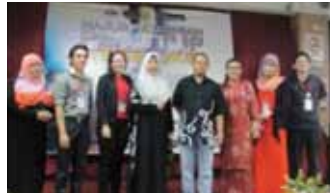
Majlis Penutup TWEET@KS dan Majlis Penyampaian Hadiah.

program ini adalah membersihkan bilik dan blok masing-masing untuk meningkatkan keceriaan Kolej Siswa. Aktiviti sampingan sempena program ini adalah mengumpul barangan kitar semula serta pelupusan basikal-basikal lama yang ditinggalkan penghuni. Aktiviti yang dijalankan di Astaka Kolej Siswa ini telah berjaya mengumpul 29 kg botol plastik dan 185 kg kertas daripada warga Kolej Siswa.