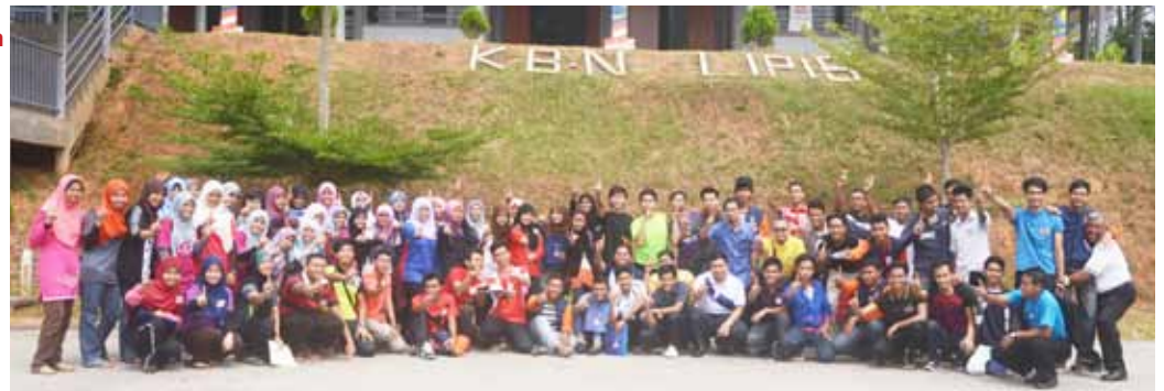
Peserta dan fasilitator yang terlibat dalam Program Latihan Transformasi Negara di Kem Bina Negara (A) Lipis.

Program ini dijalankan bagi melahirkan peserta selaku mahasiswa yang berkepimpinan dan berdisiplin kerana setiap aktiviti yang dijalankan sangat mementingkan ketepatan masa. Selain itu, ia membina keyakinan diri peserta apabila berhadapan dengan masyarakat serta komuniti