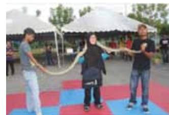
Pertunjukan ular di Karnival Jualan TWEET@KS.