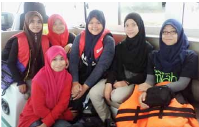
Peserta semasa dalam bot menuju ke Pulau Kapas.