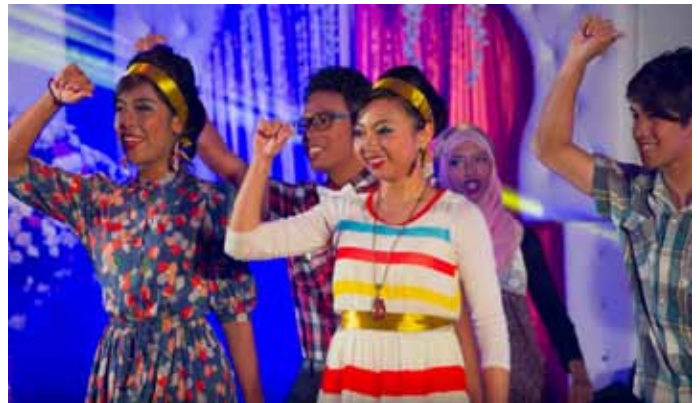
Tarian menghiburkan daripada Kelab Persadatari.