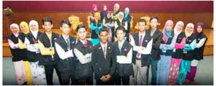
Barisan fasilitator MJM program Diploma Perikanan bagi menyambut sesi baharu, 2013/2014.

Selain itu, etika sebagai seorang fasilitator turut ditekankan