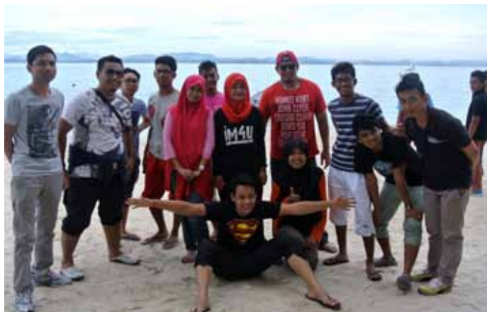
Peserta di hari pertama menyertai Kem Translead MAKLUM 2013: Lead 1 .

sangat santai dan menyeronokkan seolah-olah datang bercuti di Pulau Kapas. Beliau juga teruja apabila dapat mengenali rakan-rakan dari universiti yang pelbagai latar belakang. Keseluruhannya, kem kepimpinan selama seminggu ini menyaksikan kumpulan Ketam memonopoli kemenangan pada siri satu dan tiga, manakala pada siri dua, dimenangi oleh kumpulan Udang. Semoga objektif kem kepimpinan ini tercapai dan para peserta Translead MAKLUM 2013: Lead 1 ini akan bertemu lagi pada program Lead 2 dan seterusnya.