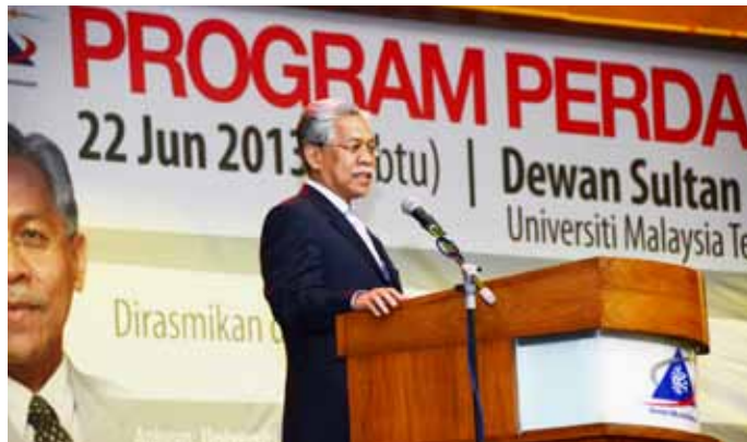
Menteri Pendidikan II, YB Dato’ Seri Idris bin Jusoh ketika menyampaikan ucapan perasmian.