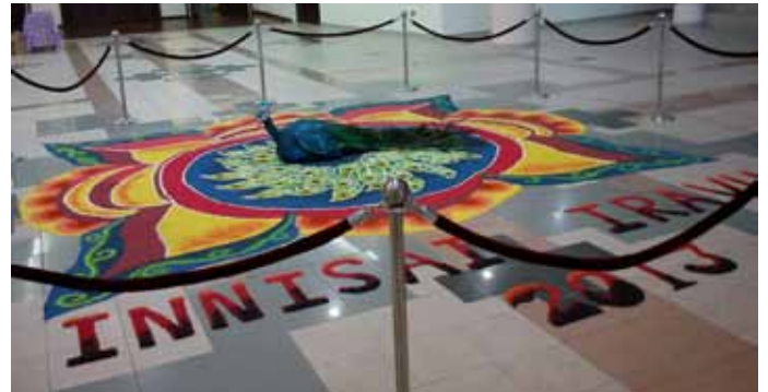
Hiasan “kolam” yang dibuat dengan beras yang diwarnakan.

Pihak KKB telah mempersembahkan tarian klasik yang dikenali sebagai “Barathanatyam” dan tarian kebudayaan yang menggunakan