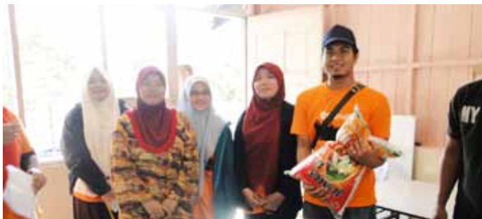
Pembahagian anak angkat.