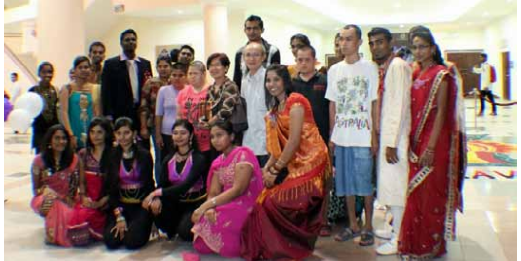
Ahli KKB bersama dari Persatuan Penjagaan Kanak- Kanak Terencat Akal, Kuala Terengganu.

Menurut Pengarah Program, semua persiapan dan persembahan merupakan hasil kerjasama daripada semua