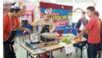
Explorace Masterchef (EMAS).