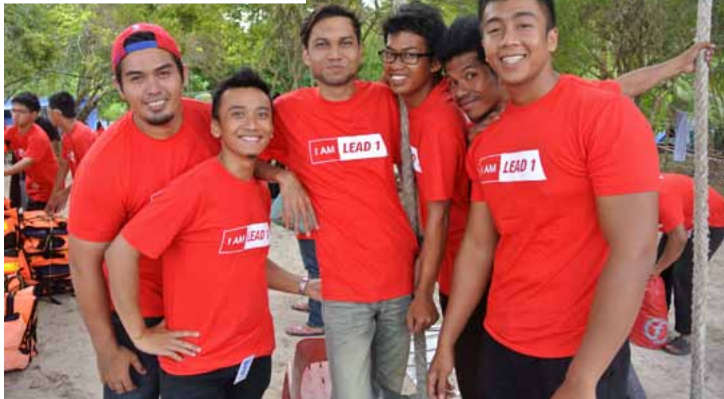
Sebahagian daripada peserta yang gembira menyertai kem kepimpinan tersebut.

Sepanjang tiga hari dua malam berada di Pulau Kapas, peserta ketiga-tiga siri menjalani aktiviti atau modul yang sama. Bermula pada hari pertama, semua peserta dibahagikan kepada lapan kumpulan sebelum digabungkan kepada empat kumpulan yang terdiri daripada kumpulan Jerung, Udang, Ketam dan Pari. Kemudian, mereka menjalani aktiviti water confident iaitu aktiviti untuk membina keyakinan diri di dalam air. Selepas itu, keempat-empat kumpulan akan bertukar-tukar tempat untuk menjalani empat lagi aktiviti outdoor iaitu memancing,