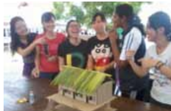
Permainan Terompa Tempurung Kelapa dan Pertandingan Gubahan Barangan Buangan dalam program Riadah Warisan Kolej Siswa (RAWKS).