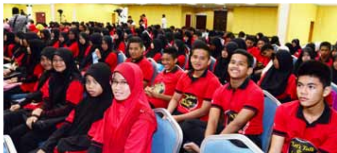
Sebahagian daripada 260 orang pelajar terlibat dengan program “Let’s Talk and Let’s Go Global”.

menengah. Selain itu, program ini dilaksanakan untuk memberi kesedaran kepada masyarakat