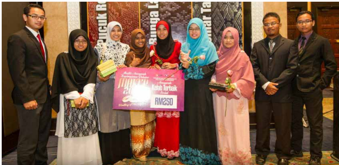
Pemenang MAKEP 2012 bergambar kenangan selepas menerima anugerah.