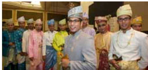
Barisan MPP ibarat raja sehari yang ditaja khas dari Butik Seri Cendana.

Apabila ditanya kepada Pengarah Program MAKEP