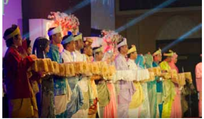
Barisan MPP membawa dulang trofi MAKEP.

Beliau juga berharap MAKEP akan datang lebih berjaya dan berprestij dari sebelumnya. Persiapan awal harus dibuat dan kerjasama dari semua ahli jawatankuasa daripada yang tertinggi hingga yang paling bawah amat penting untuk menjayakan program ini. Tambah beliau, nantikan MAKEP peringkat kebangsaan yang bakal diadakan pada tahun ini jika diizinkan. MAKEP peringkat kebangsaan ini bakal disertai oleh semua IPT dan dianjurkan oleh UMT. Idea ini dicetuskan oleh YBhg. Dato' Naib Canselor selepas melihat pencapaian MAKEP UMT yang sangat memberangsangkan.