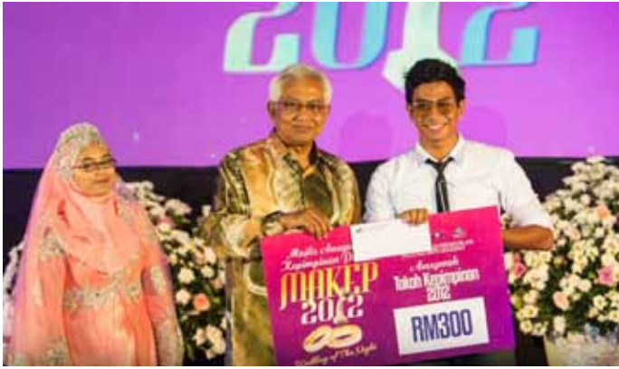
Naib Canselor UMT menyampaikan hadiah kepada pemenang Tokoh Kepimpinan Pelajar 2012.

2012 tentang perasaan beliau mengendalikan program ini, beliau berkata "Sejujurnya apabila pertama kali diberi amanah untuk mengendalikan majlis ini, saya berasa sangat gementar dan takut tetapi saya tetap menyahut cabaran kerana saya suka mencuba benda-benda yang baharu. Setelah melakukan kajian dan persiapan yang dibuat selama dua bulan dengan ditambah pelbagai halangan dan masalah, saya masih mampu tersenyum dan gembira apabila YBhg. Dato' Naib Canselor memberikan respon yang positif mengenai MAKEP. YBhg. Dato' juga sangat berpuas hati dengan hasil kerja MAKEP."