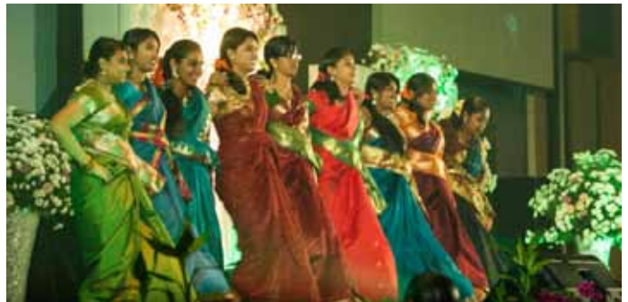
Tarian mengasyikkan daripada Kelab Kebudayaan Baratham UMT.