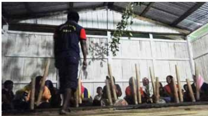
Persembahan Tarian Sewang oleh penduduk