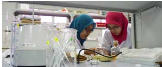
Perancangan kerja yang teratur memudahkan perjalanan membuat PITA.

Tamsilnya, bagi mereka yang mengambil kursus PITA ini, persediaan dari segi mental dan fizikal perlulah dilakukan sebaik mungkin bagi mengatasi segala kemungkinan yang akan berlaku. Umum sedia maklum, pengorbanan yang mungkin dilakukan oleh mahasiswa sepanjang PITA dijalankan mencakupi masa, tenaga dan kehidupan harian.