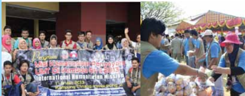
Antara aktiviti yang dijalankan oleh Kelab Penyayang.