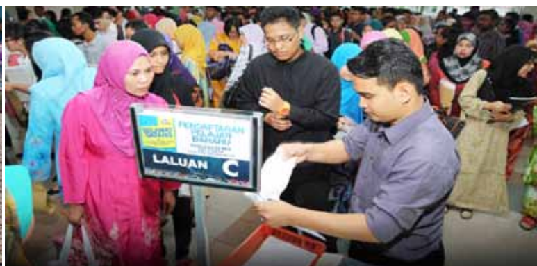
Melalui sesi pendaftaran di Dewan Sultan Mizan.

Nilai Harta bagi seorang bapa adalah melihat kecemerlangan anak-anak