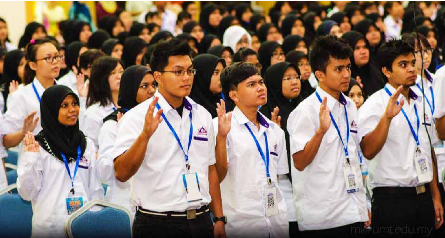
Lafaz ikrar dilaksanakan di Majlis Ikrar Pelajar Baharu UMT Sesi 2013/2014 di Dewan Sultan Mizan.