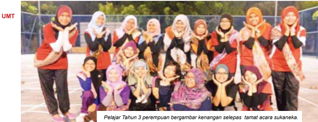
Pelajar Tahun 3 perempuan bergambar kenangan selepas tamat acara sukaneka.

Program dimulakan pada hari pertama, dengan pendaftaran peserta dan senamrobik. Aktiviti senamrobik dijalankan sebagai acara pembuka di Gelanggang Serbaguna Mahasiswa. Pertandingan pertama yang dijalankan ialah Cabaran Kolej Siswa yang disertai oleh 11 buah kumpulan yang terdiri daripada lima orang ahli setiap kumpulan. Aktiviti ini memerlukan kepantasan dan ketajaman minda para peserta secara tidak langsung dapat memperkenalkan Kolej Siswa secara santai kepada penghuni kolej. Para peserta perlu menyelesaikan 11 check point bagi