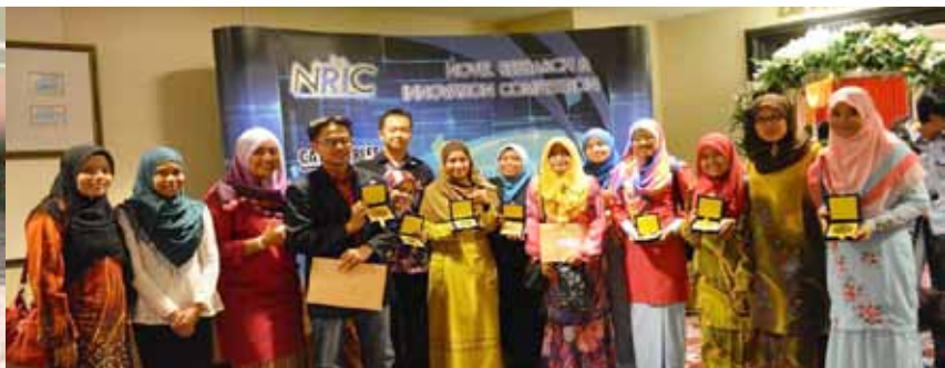
Penyelidik muda UMT bersama pingat yang dimenangi.

Pada 19-20 Ogos yang lalu telah berlangsungnya pertandingan bertaraf antarabangsa iaitu Novel Research Innovation Competition 2013 yang turut disertai oleh Universiti Malaysia Terengganu (UMT). Pertandingan ini bertempat di Dewan Utama Universiti Sains Malaysia. Pertandingan ini terbuka kepada mahasiswa-mahasiswa tahun akhir yang ingin mempertandingkan hasil penyelidikan mereka sebelum bergraduasi. Penyertaan pertandingan ini diwakili oleh seluruh universiti-universiti awam serta swasta sekitar Malaysia dan beberapa universiti antarabangsa salah satu darinya ialah Princess of Narathiwat University dari Thailand. Mahasiswa UMT berjaya merangkul lapan anugerah yang terdiri daripada tiga pingat perak dan lima pingat gangsa. Para penyelidik muda dari UMT memberikan yang terbaik dan akhirnya mengangkat nama UMT ke peringkat antarabangsa.