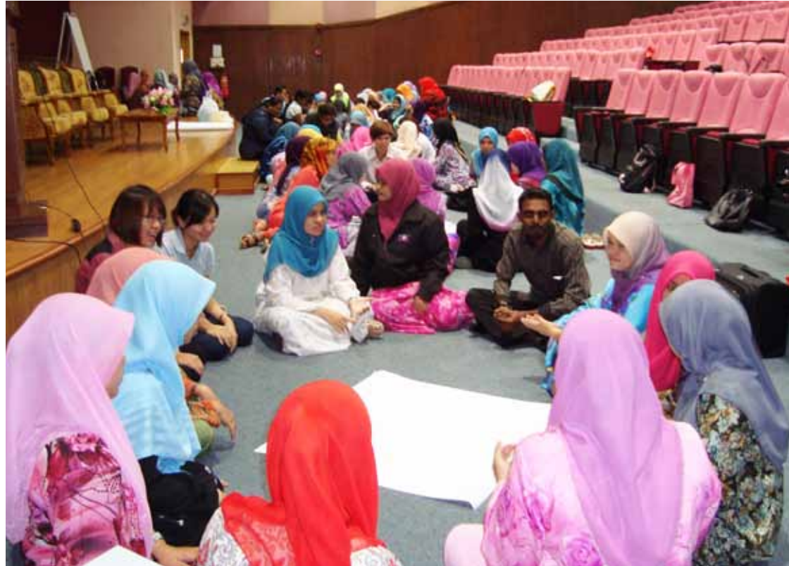
Aktiviti Latihan Dalam Kumpulan.

Sesi kedua melibatkan sesi kemahiran perniagaan dan promosi produk di mana pelajar didedahkan dengan pengalaman sebenar