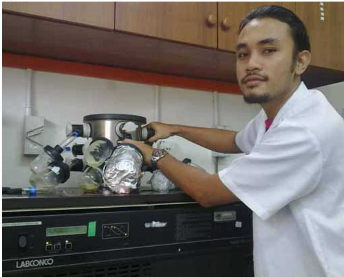
Antara tugas yang dilakukan sebagai Pegawai Jaminan Kualiti.