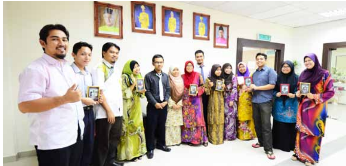
Hari terakhir di Penerbit UMT, penulis (lima dari kiri) bersama rakan-rakan praktikal serta semua staf Penerbit UMT.

kerana buat pertama kalinya penulis merasai suasana sebagai seorang pekerja. Berada bersama staf Penerbit UMT yang ceria menyebabkan penulis hilang rasa