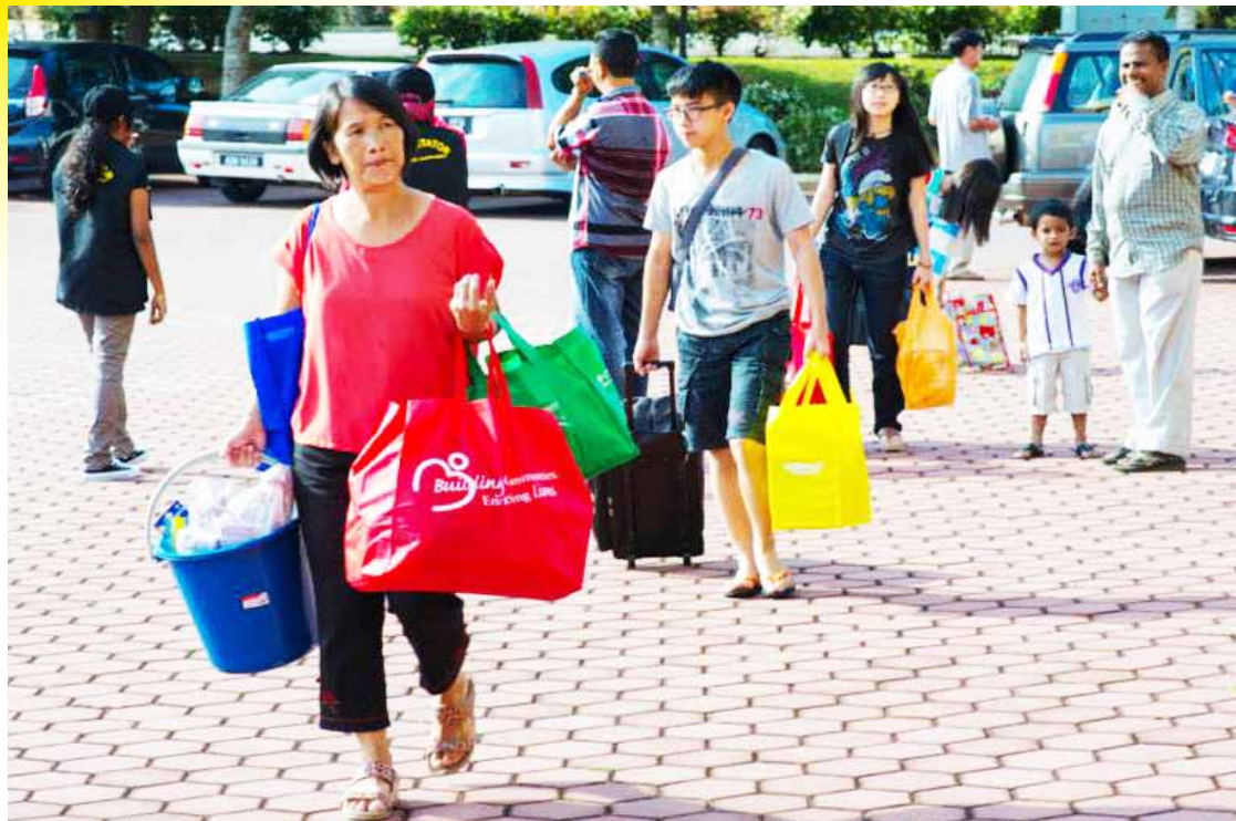
Kaum keluarga pelajar turut teruja membantu ahli keluarga mereka mengangkut barang ke kampus UMT.

Terdapat pelbagai slot yang telah disediakan untuk para pelajar baharu sepanjang