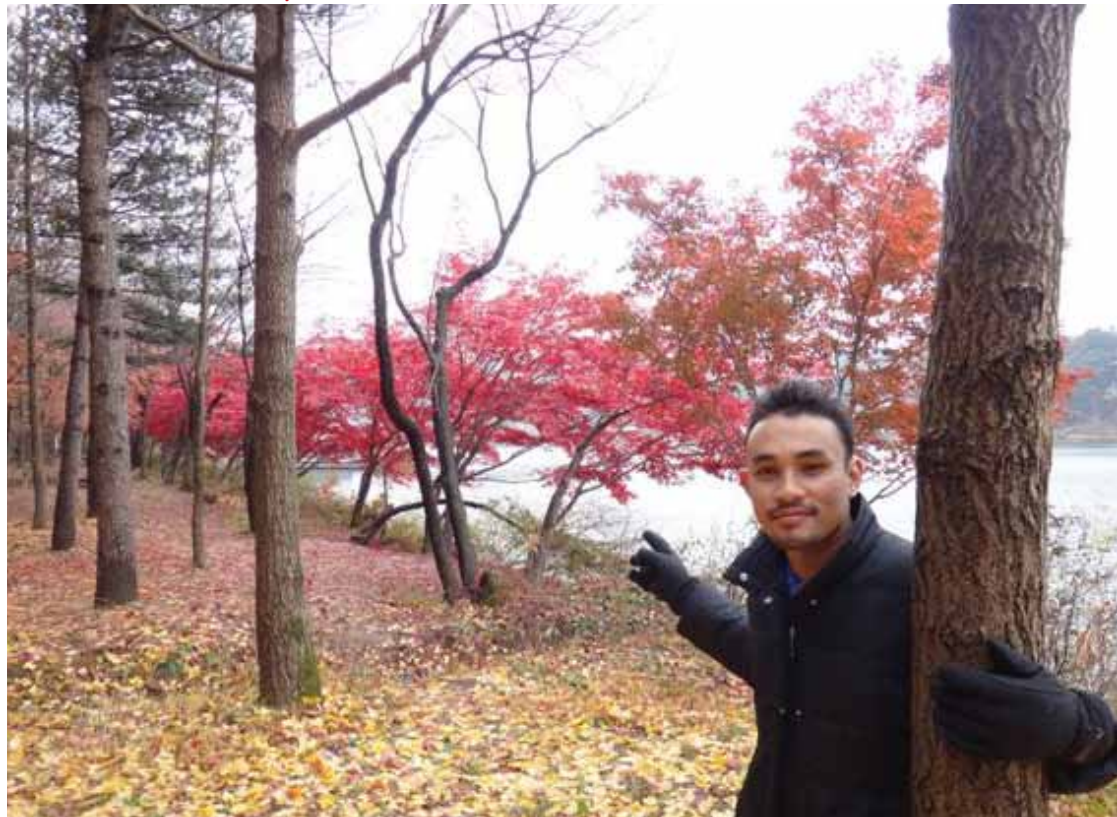
Pengalaman berkhidmat sebagai MPP UMT memberi peluang untuk menjejakkan kaki ke Korea.

Nasihat saya kepada graduan, janganlah kita memilih pekerjaan pada masa kini. Bukan universiti kita sahaja yang mengeluarkan graduan, malah berpuluh ribu graduan yang keluar dari IPTA/S dalam negara mahupun luar negara pada masa yang sama. Oleh itu, kita perlu bersikap mencari peluang pekerjaan bukan pekerjaan mencari kita. Jika kita mempunyai peluang kita harus mencuba untuk sesuatu pekerjaan kerana apa yang penting adalah pengalaman kerja yang diperolehi. Hal ini kerana ganjaran yang diterima bagi mereka yang mempunyai pengalaman dalam pekerjaan adalah tinggi berbanding mereka yang tidak mempunyai pengalaman.