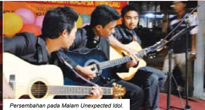
Persembahan pada Malam Unexpected Idol.