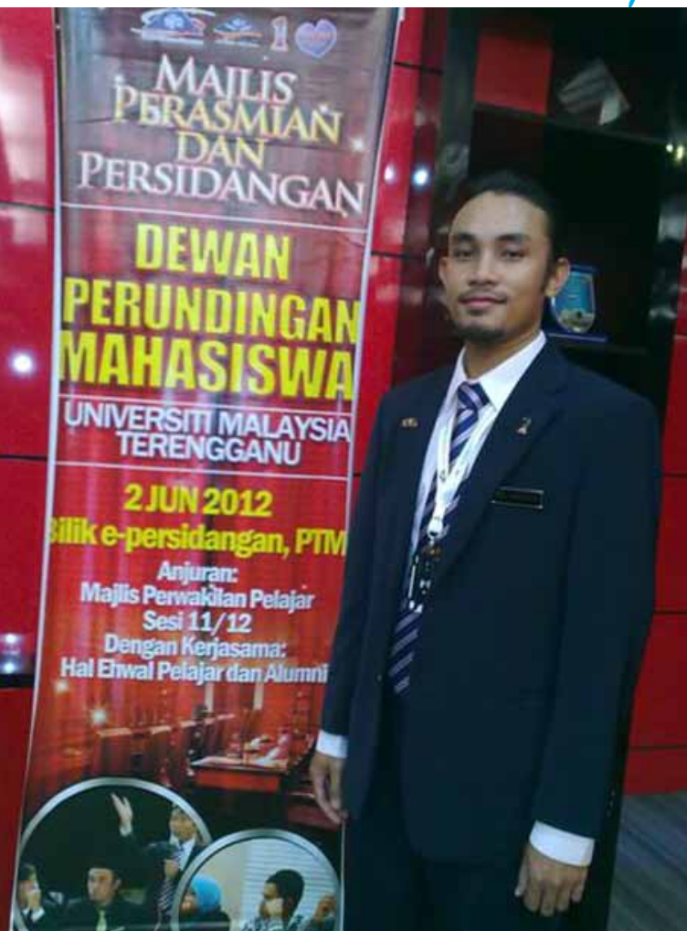
Kenangan... Sewaktu menjalankan tugas sebagai MPP UMT.