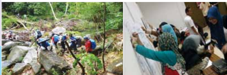
Antara aktiviti yang dijalankan oleh Kelab Pembimbing Rakan Siswa.