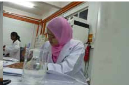
Menganalisis setiap dapatan selepas membuat uji kaji.