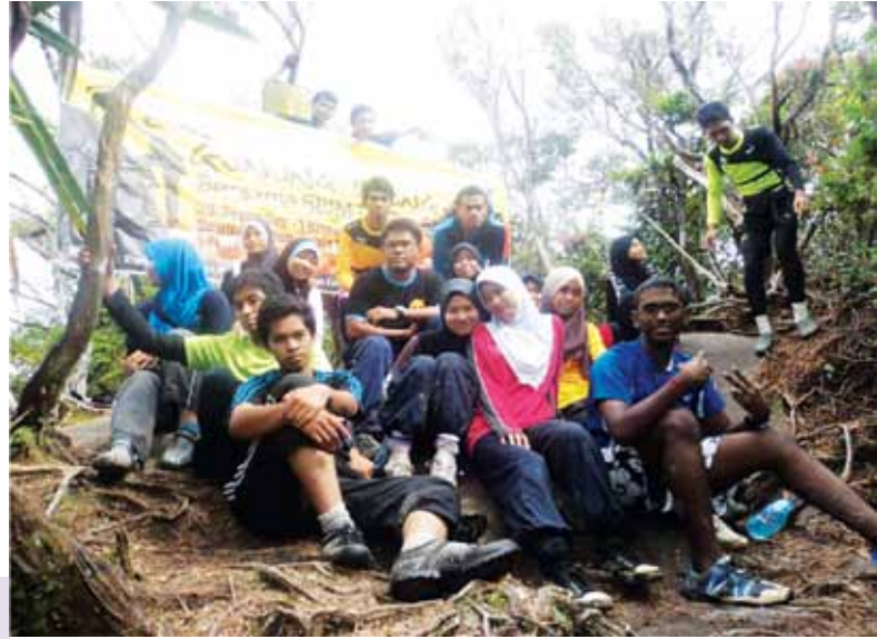
Antara aktiviti yang dijalankan oleh Sekreteriat Rakan Integriti Mahasiswa.

Aktiviti yang pernah diadakan: Program Konvoi Amal Belia Integriti, Kuiz Integriti Mahasiswa, Lualan Hijrah, Ekspedisi Gunung Stong, Program Bakti Siswa Super Kampung Style , Artegrity Photoshoot Contest .