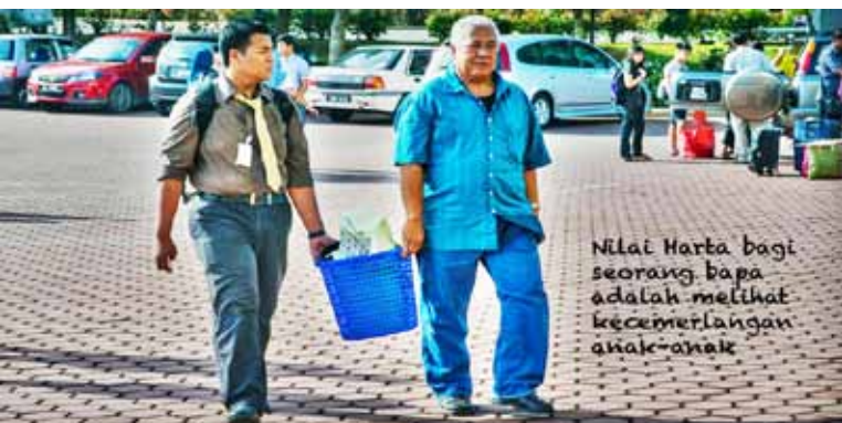
Pelajar baharu melangkah kaki ke kampus UMT ditemani bapa tersayang.

Sepanjang MJM ini berlangsung, para pelajar telah mendapat pelbagai informasi yang berguna dan dapat dimanfaatkan sepanjang bergelagor pelajar sarjana muda di UMT. Kami dari pihak Samudera ingin mengalu-alukan kedatangan pelajar baharu ke UMT dan berharap semoga mereka bakal menaikkan dan mengharumkan nama UMT.