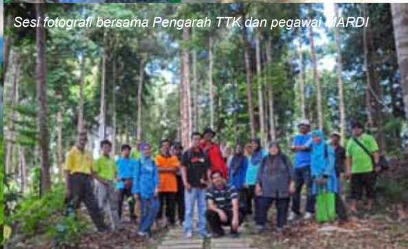
Sesi fotografi bersama Pengarah TTK dan pegawai MARDI