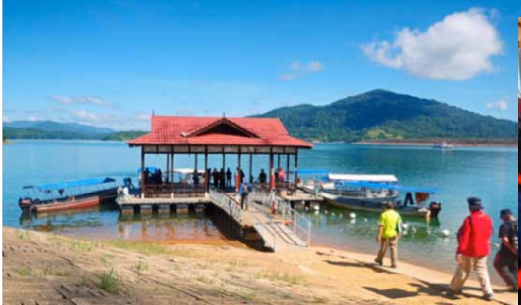
Peserta bersedia menaiki bot di Pengkalan Gawi, Kenyir.

oleh: Zakiah Hamzah, Mohd. Fazlin Mat Saaidin, Faridah Mohamad Jabatan Sains Biologi