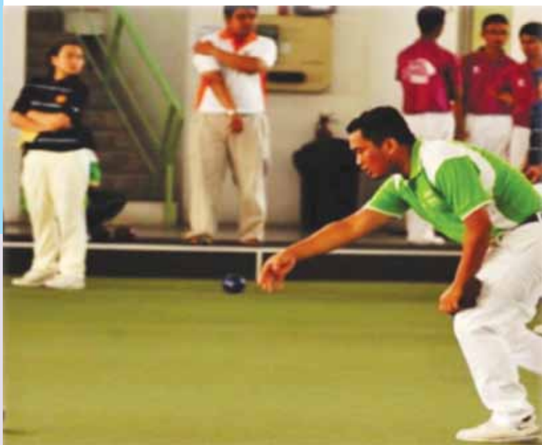
Antara aktiviti yang dijalankan oleh Kelab Lawn Bowl UMT.