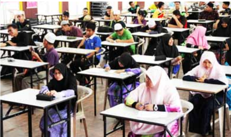
Para pelajar sedang bersedia untuk mengambil ujian pra matematik tambahan.