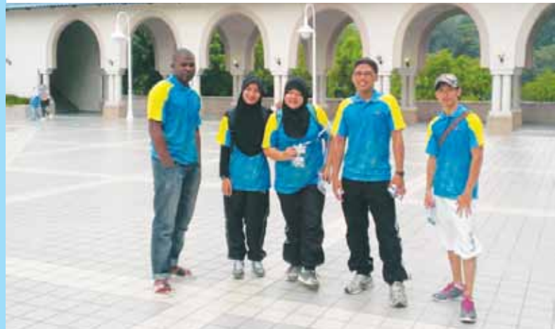
Barisan kepimpinan Kelab Taekwondo.