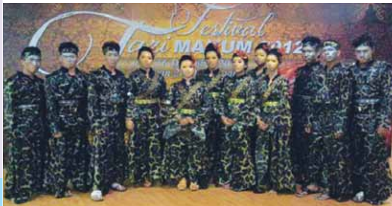
Antara aktiviti yang dijalankan oleh Kelab Kesenian Persadartari.