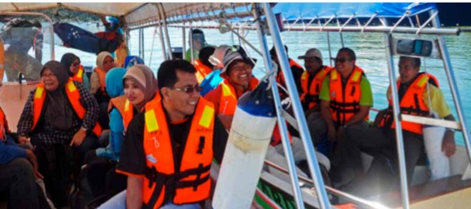
Peserta dalam perjalanan menaiki bot ke Pulau Tekak Besar, Kenyir.