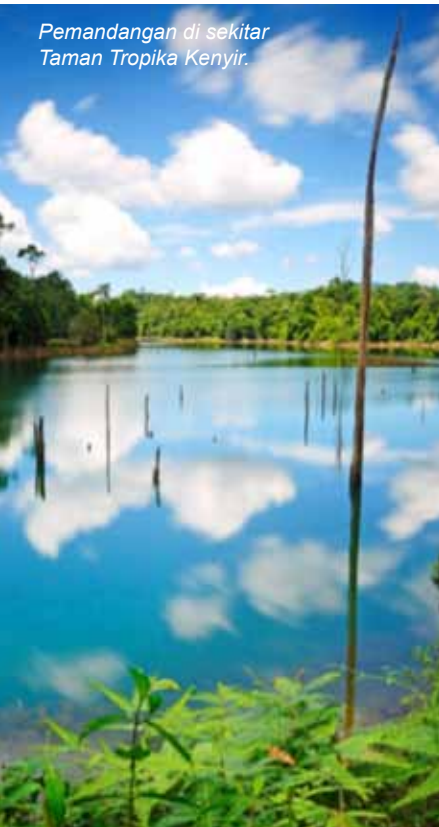
Pemandangan di sekitar Taman Tropika Kenyir.