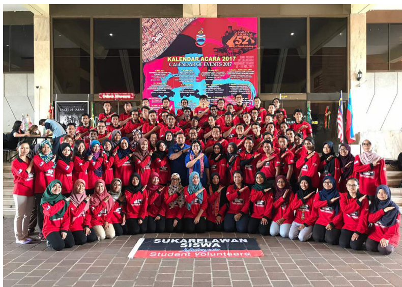
Ini adalah ahli kumpulan merangkumi ahli keluarga saya selama 2 minggu kami berada di Salarom Taka.