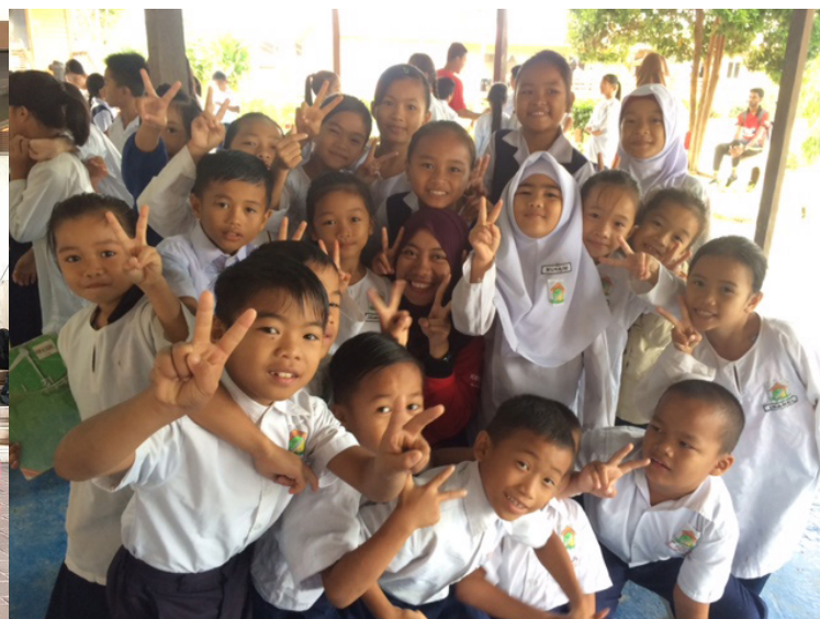
Ini adalah antara pelajar - pelajar SK Salarom dan aktiviti sukan yang kami lakukan semasa hari sukaneka bersama pelajar SK Salarom.

masa selama 7 jam untuk ke Kampung Salarom Taka dengan menaiki trak askar. Satu pengalaman yang saya tidak boleh lupakan di mana di dalam trak itulah kami mula berkenal-kenal, menyanyi bersama, tidur merata di dalam trak. Pemandangan kaki bukit/gunung di Sabah sangat mencuri perhatian saya.