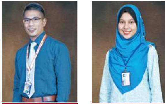
Contoh Penampilan Kad Matrik Pelajar