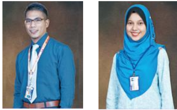
Contoh Penampilan Kad Matrik Pelajar