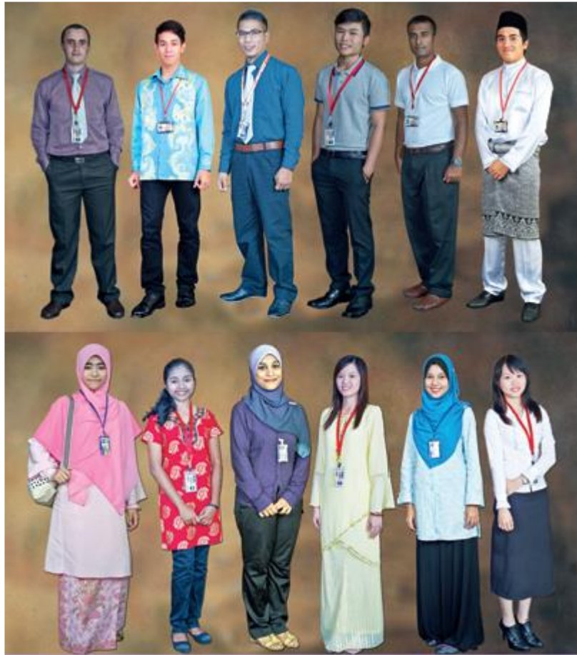
Contoh Penampilan Pakaian Pelajar