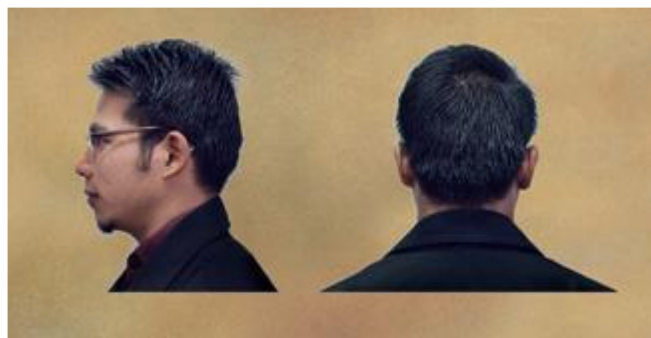
Contoh Penampilan Rambut Pelajar